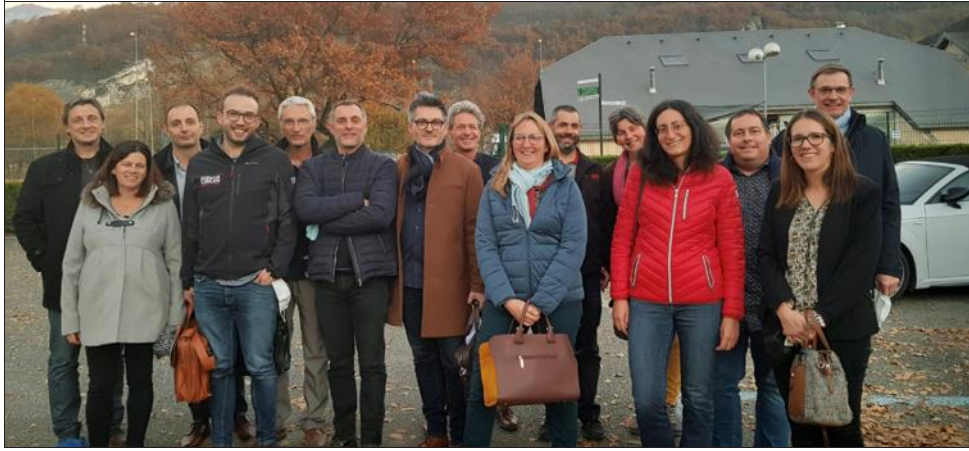
Les géomètres experts de Savoie se sont réunis en assemblée générale à Voglans.

L'assemblée générale de la chambre des Géomètres-experts de Savoie (UNGE 73) s'est déroulée vendredi 19 novembre à Voglans.